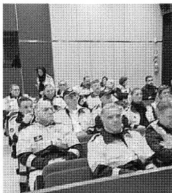
I volontari di Protezione civile del Comune di Carpi